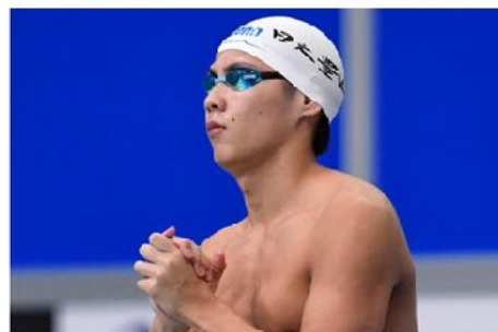
柳本幸之介(日本大学)青嶺中学校卒 2020年 100m自由形 長水路日本高校新記録樹立 2020年 200m自由形 短水路日本高校新記録樹立 2021年 第97回日本選手権水泳競技大会 200m自由形準優勝 2021年 東京オリンピック日本代表 2024年 パリオリンピック日本代表 2024年 SAGA2024 国スポ佐賀県代表